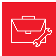
Betriebs- und Geschäftsführung